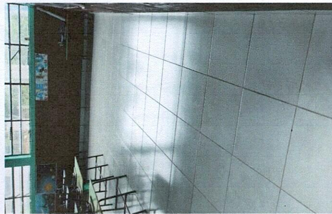
Foto 3: Mejoramiento de loza del establecimiento a piso tipo ceramico, finalizado