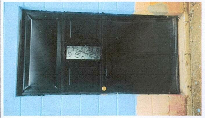
Foto 2: Mejoramiento de puertas del establecimiento y de cocina, Finalizado